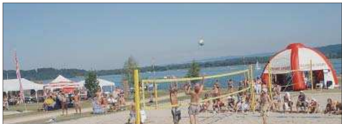
L'accès au Saintjouxbeach restera gratuit. Mais pas celui aux concerts du soir.

En parallèle, les «Elements games» proposeront une kyrielle d'activités et d'animations durant les trois jours de manifestation sur les thèmes de l'air, de l'eau, du feu et du sable. Un trampolin à élastique, une tyrolienne aquatique et du wakeboard, notamment viendront animer le Saintjouxbeach Festival. /ste