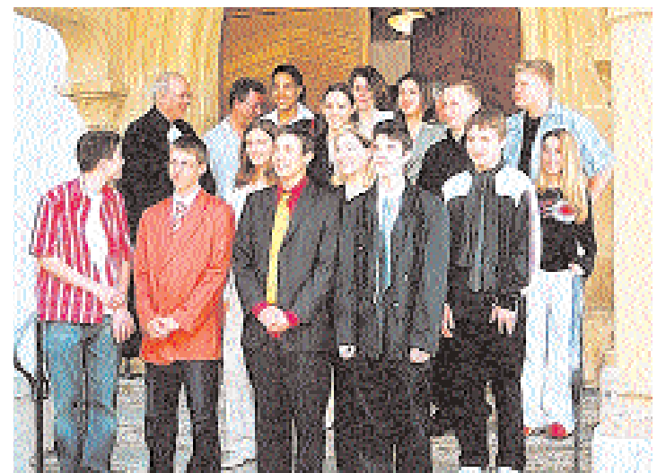
Les catéchumènes ont franchi une étape importante de leur vie. (ltd)

Une fois de plus, accompagnés par le pasteur Devaux, ils ont découvert la vie, le travail de ces moines, leur histoire et même leur extension jusqu'à l'île de Saint-Pierre. Le silence, la musique, la méditation, la beauté intemporelle des chants de l'office de prière à Taizé ont marqué chaque participant. Ce moment laissera certainement des traces dans plus d'un cœur d'ado. Enco-